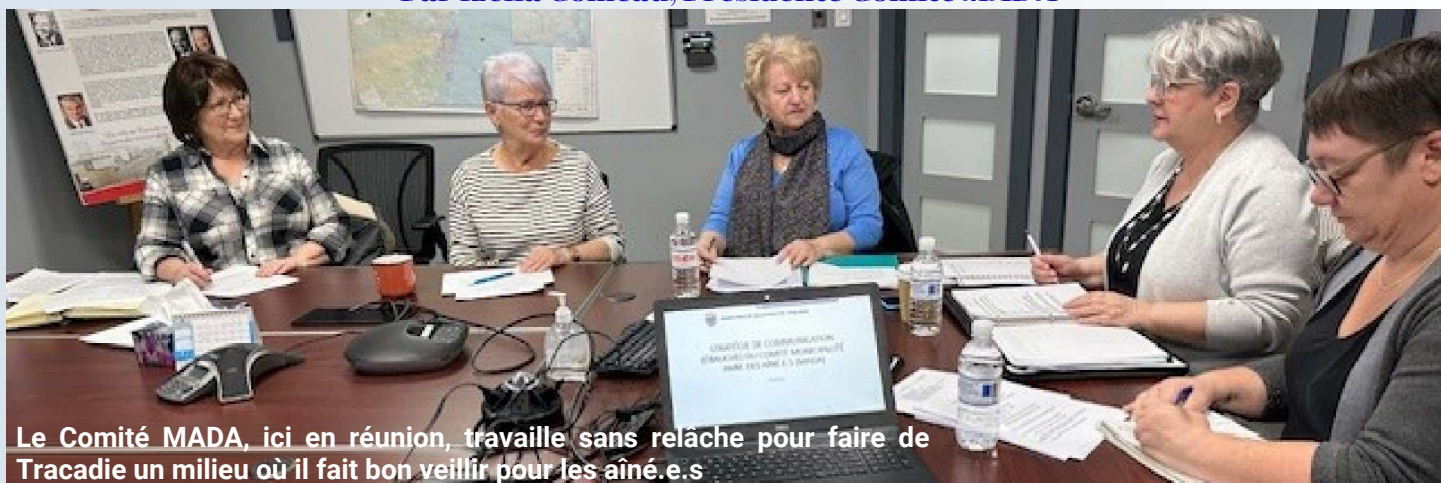
Le Comité MADA, ici en réunion, travaille sans relâche pour faire de Tracadie un milieu où il fait bon vieillir pour les aîné.e.s