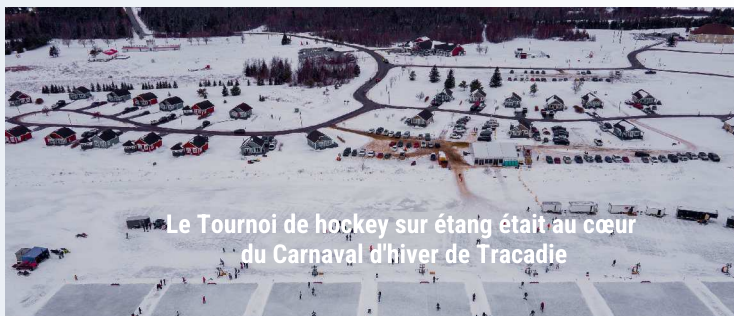
Le Tournoi de hockey sur étang était au cœur du Carnaval d'hiver de Tracadie