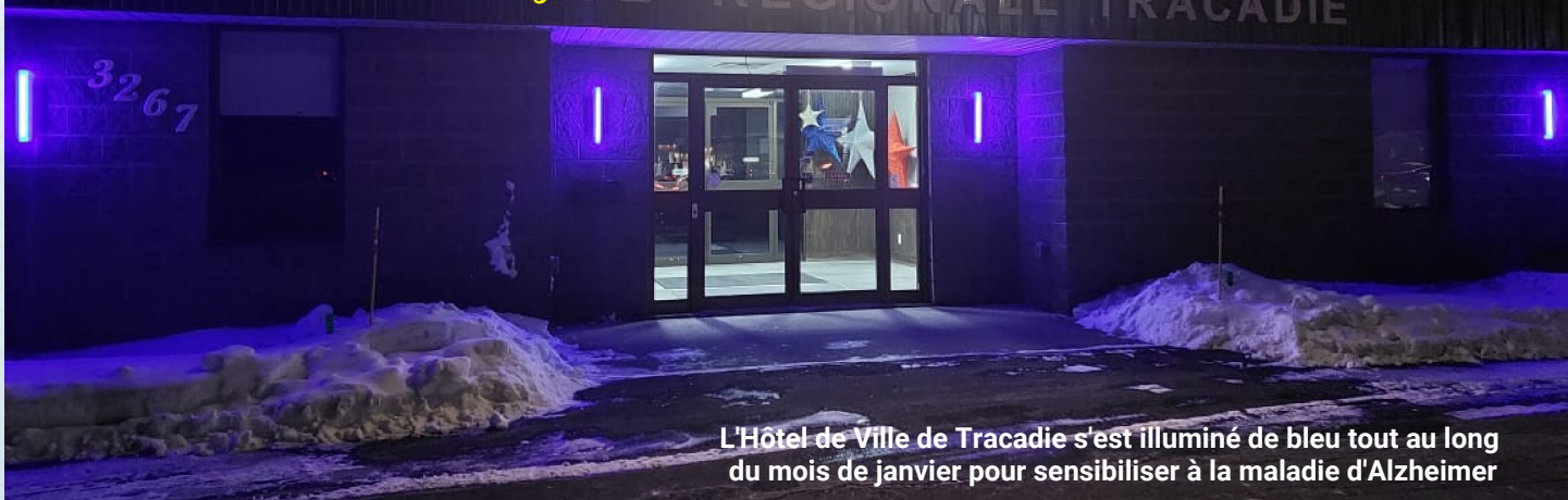
L'Hôtel de Ville de Tracadie s'est illuminé de bleu tout au long du mois de janvier pour sensibiliser à la maladie d'Alzheimer

En janvier 2024, le conseil municipal de Tracadie a fièrement décrété le mois comme celui de sensibilisation à la maladie d'Alzheimer.