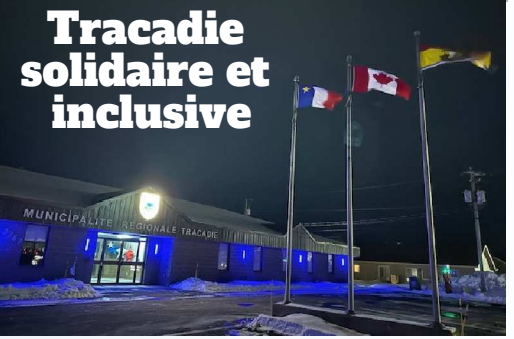
Tracadie solidaire et inclusive