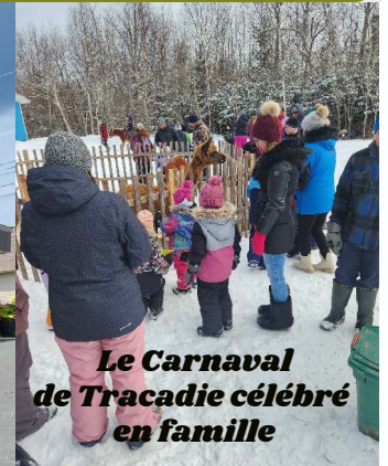
Le Carnaval de Tracadie célébré en famille