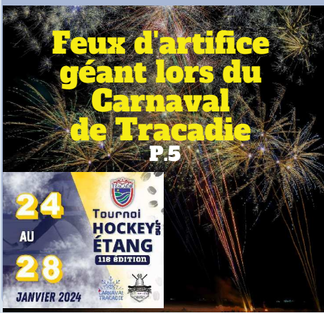
Feux d'artifice géant lors du Carnaval de Tracadie P.5