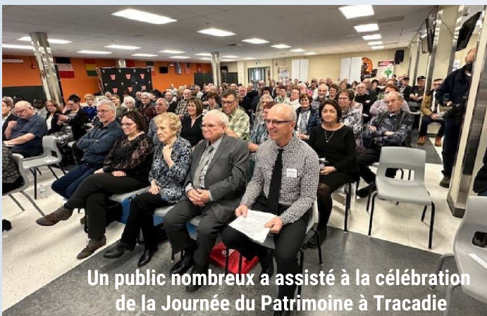
Un public nombreux a assisté à la célébration de la Journée du Patrimoine à Tracadie

La Journée du Patrimoine de Tracadie s'est terminée aux alentours de 15 h 30, à la grande satisfaction des participants. Cette journée a été l'occasion pour les résident.e.s de la région de se rassembler et de célébrer leur riche patrimoine culturel. Le succès de l'événement témoigne de l'attachement profond des Tracadien.ne.s à leur histoire et à leur culture.