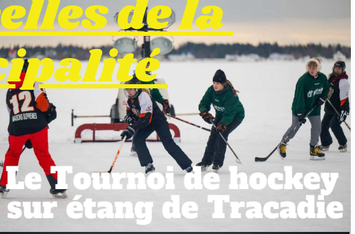
Le Tournoi de hockey sur étang de Tracadie