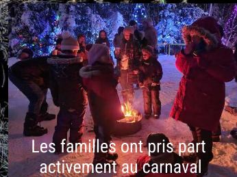
Les familles ont pris part activement au carnaval

Du 20 au 28 janvier dernier, le Carnaval de Tracadie a enchanté les familles et les visiteurs avec une programmation riche en activités hivernales. Parallèlement au célèbre tournoi de hockey sur étang, le carnaval a offert une multitude d'occasions de profiter du grand air et de célébrer l'esprit festif de l'hiver.