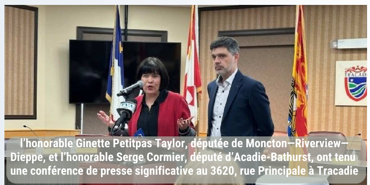
L'honorable Ginette Petitpas Taylor, députée de Moncton—Riverview—Dieppe, et l'honorable Serge Cormier, député d'Acadie-Bathurst, ont tenu une conférence de presse significative au 3620, rue Principale à Tracadie

« Carrefour giratoire » de la Péninsule acadienne, Tracadie, avec son choix pour l'annonce des mesures fédérales de portée nationale, confirme ainsi son important rayonnement la positionnant comme un épice centre incontournable dans la région, voire au-delà.