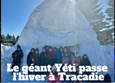
Le géant Yéti passe l'hiver à Tracadie