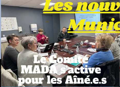
Le Comité MADA s'active pour les Aîné.e.s