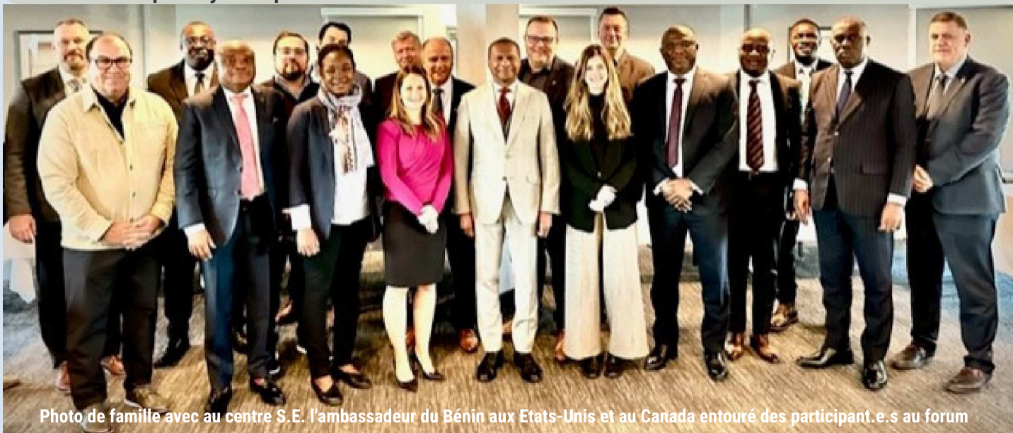
Photo de famille avec au centre S.E. l'ambassadeur du Bénin aux États-Unis et au Canada entouré des participant.e.s au forum

Du 23 au 25 octobre derniers, Moncton a accueilli un forum économique pionnier, rassemblant des acteurs clés du Nouveau-Brunswick et des partenaires de l'Afrique sub-saharienne. Soutenue par le Consulat du Bénin à Moncton, le Conseil Économique du Nouveau-Brunswick (CENB), ainsi que les villes jumelées de Tracadie et de Tori-Bossito au Bénin, cette initiative a marqué un pas significatif vers des liens économiques dynamiques et durables.