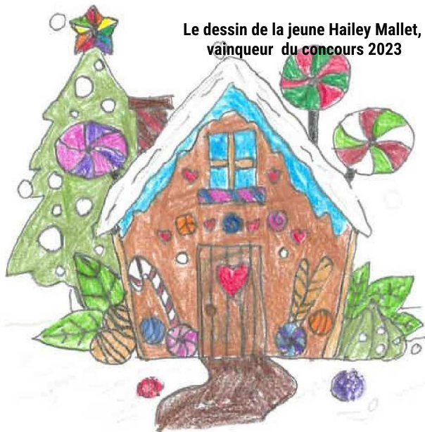
Le dessin de la jeune Hailey Mallet, vainqueur du concours 2023

La créativité éblouissante de nos jeunes élèves a été mise en lumière lors du concours annuel de dessin pour les cartes de vœux de la municipalité. Une initiative entamée en 2020, ce concours offre une plateforme aux génies en herbe artistiques des écoles primaires, les invitant à partager leur vision unique de la magie de Noël.