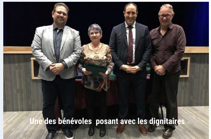
Une des bénévoles posant avec les dignitaires