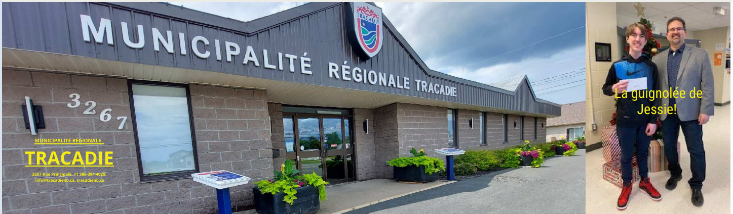
La guignolée de Jessie!

Infolettre trimestrielle de la Municipalité régionale de Tracadie