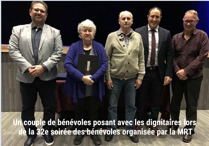
Un couple de bénévoles posant avec les dignitaires lors de la 32e soirée des bénévoles organisée par la MRT

La Municipalité régionale de Tracadie a célébré, le mardi 7 novembre 2023, la 32e édition de la soirée de reconnaissance aux bénévoles. Cet événement annuel vise à honorer les personnes dévouées qui contribuent de manière exceptionnelle au développement des associations à but non lucratif locales dans les domaines communautaire, culturel, récréatif et sportif. Des personnalités inspirantes se sont illustrées à l'instar de Lloyd LeBlanc ou encore du jeune Louis Sonier.