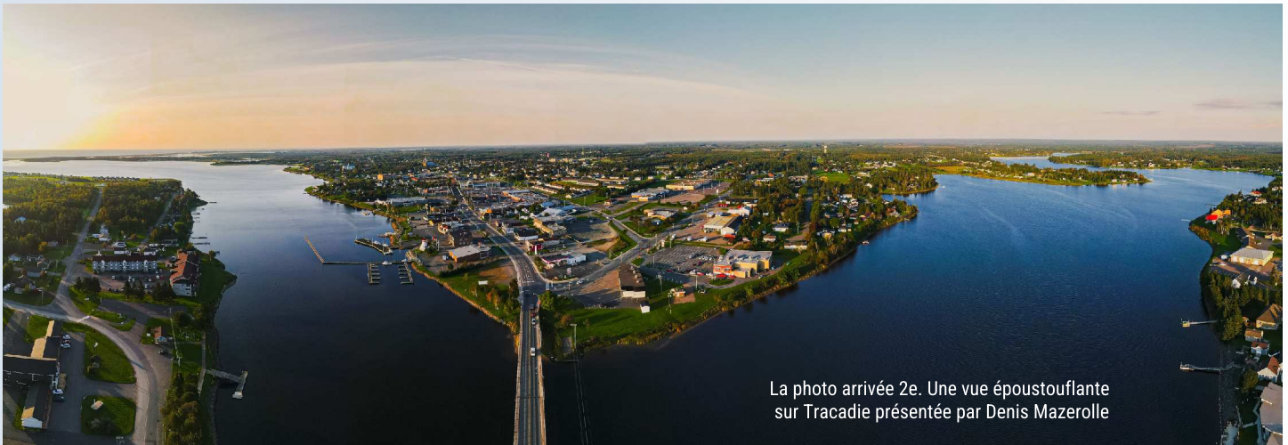
La photo arrivée 2e. Une vue époustouflante sur Tracadie présentée par Denis Mazerolle