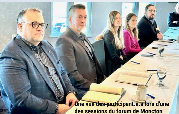
Une vue des participant.e.s lors d'une des sessions du forum de Moncton

Réunissant opérateurs économiques et responsables du développement décentralisé de villes africaines et canadiennes, le forum a été une plateforme propice aux échanges et à la création de liens fructueux. Les représentants politiques et économiques de chaque pays ont eu l'opportunité de mettre en lumière le potentiel de leurs territoires respectifs, partager leurs visions et discuter des défis économiques actuels.