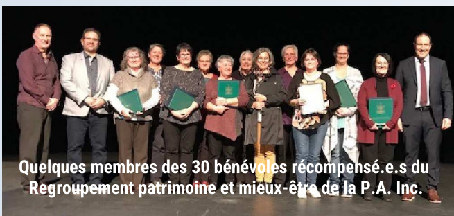
Quelques membres des 30 bénévoles récompensés.e.s du Regroupement patrimoine et mieux-être de la P.A. Inc.

Elles confectionnent des mitaines, tuques, bas, couvertures et autres pour donner aux gens dans le besoin de la région ainsi que les hôpitaux. Ces bénévoles répondent aux besoins de fournir aux hôpitaux des couvertures en oncologie, des bas en dialyse, des bonnets en pouponnière et elles confectionnent des surprises pour les enfants qui ont une prise de sang en oncologie. On donnerait une médaille à chacune d'elles car elles le méritent par leurs dévouements. Elles donnent du temps d'efforts du déplacement pour se rendre au local bénévolat. On est impressionné par la qualité de ces bénévoles qui font partie de l'organisme.