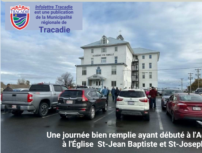
Une journée bien remplie ayant débuté à l'Académie Ste-Famille avant de se poursuivre à l'Église St-Jean Baptiste et St-Joseph puis au Club Sportif de Pont la France.

Infolettre Tracadie est une publication de la Municipalité régionale de Tracadie