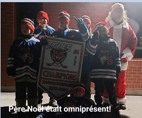
Père Noël était omniprésent!

Dès la tombée de la nuit, les rues du centre-ville se sont remplies de spectateurs, rassemblés pour assister à ce spectacle festif. Organisé par des associations communautaires et des bénévoles, avec le soutien de l'administration municipale, le défilé a été marqué par une affluence massive. À 18h30 précises, les chars allégoriques ornés de décors festifs ont pris le départ, suivis de fanfares, de groupes communautaires et, bien sûr, du Père Noël, accompagné cette année par une charmante Maman Noël.