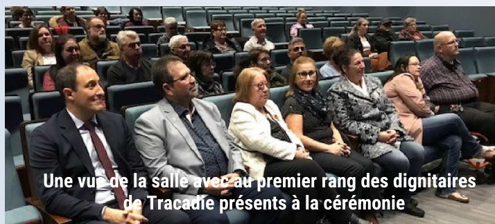
Une vue de la salle avec au premier rang des dignitaires de Tracadie présents à la cérémonie