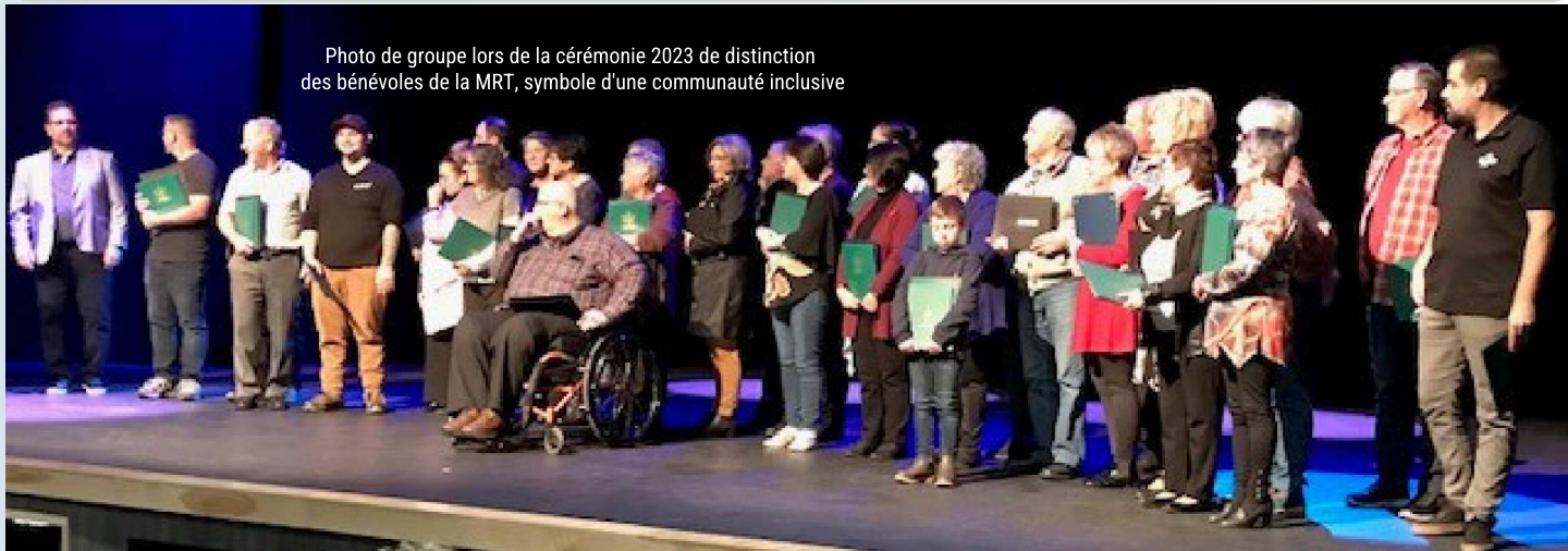
Photo de groupe lors de la cérémonie 2023 de distinction des bénévoles de la MRT, symbole d'une communauté inclusive

Cher.e.s résident.e.s, lectrices et lecteurs assidu.e.s des plateformes numériques de la Municipalité régionale de Tracadie (MRT), vous avez peut-être remarqué l'émergence de l'écriture inclusive dans nos messages. Cette pratique, bien que parfois controversée, suit la tendance nationale canadienne, notamment au sein des entités francophones.